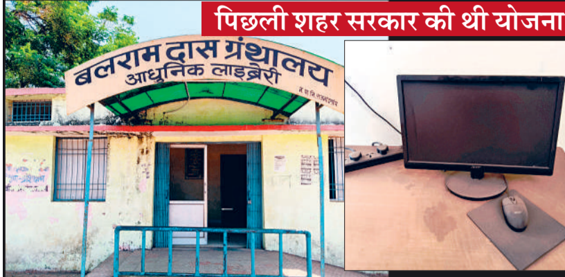
पिछली शहर सरकार की थी योजना

आतिथ्य में किया गया था। यह ग्रंथालय सिर्फ नाम का आधुनिक है। जबकि यहां आधुनिकता के संसाधन नजर नहीं आते हैं। बिना इंटरनेट के एंड्राइड मोबाइल फोन भी किसी काम का नहीं लगता है। ऐसे जमाने में यहां बगैर इंटरनेट का कम्प्यूटर लगा दिया गया है। इस आधुनिक लाइब्रेरी में सिर्फ न्यूज पेपर पढ़ने की सुविधा है। यहां रखे पुस्तकों की बाइंडिंग खराब हो चुकी है। लाइब्रेरी का रखरखाव भी ठीक नहीं है। सफाई के अभाव सहित कई समस्याएं हैं।